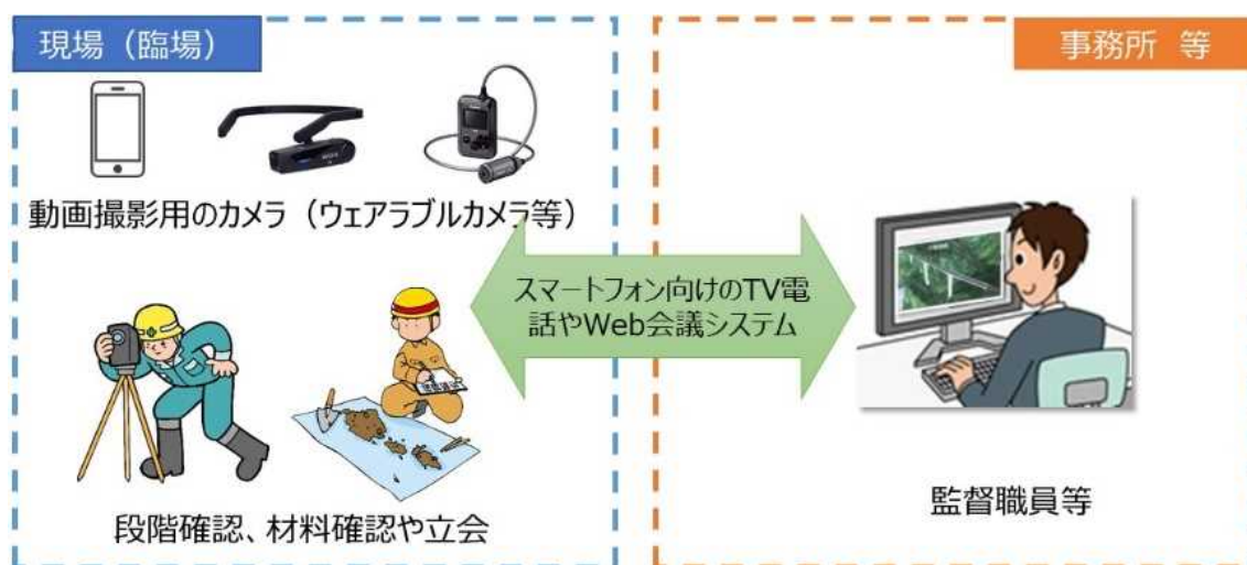
図 2-1 機器構成（例）