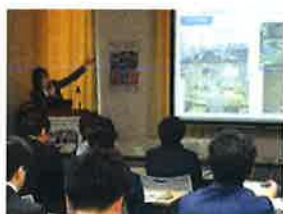
雇用支援セミナー