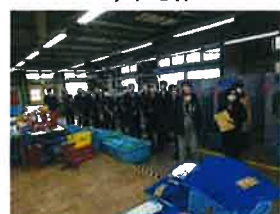
刑務所・少年院 スタディツアー