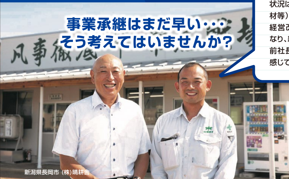
新潟県長岡市 (株)晴耕舎