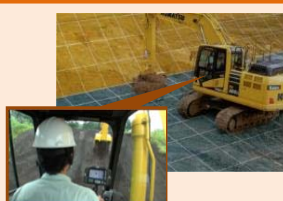
3次元設計データに 基づき建設機械を制御