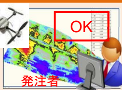
完成形状と3次元設計 データとの重ね合わせ

※ICT施工とは、測量から検査に至る各工程に情報通信技術を取り入れ、施工の高効率・高精度化を図ることで生産性の向上や品質の確保を実現するシステム