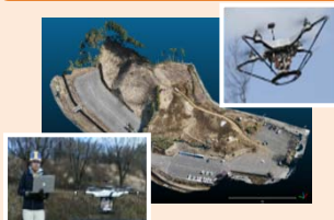
現況地形の 3次元点群データ化