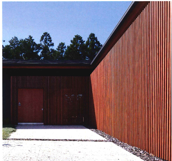
株式会社ユーゴー本社 協力 井川建築設計事務所