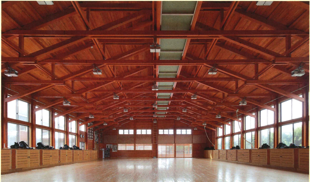
千葉県立安房高等学校 柔剣道場 協力 山田憲明構造設計事務所 美建設計