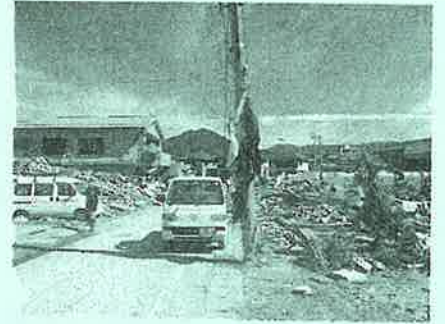
(西予市野村町 2018 年 7 月)