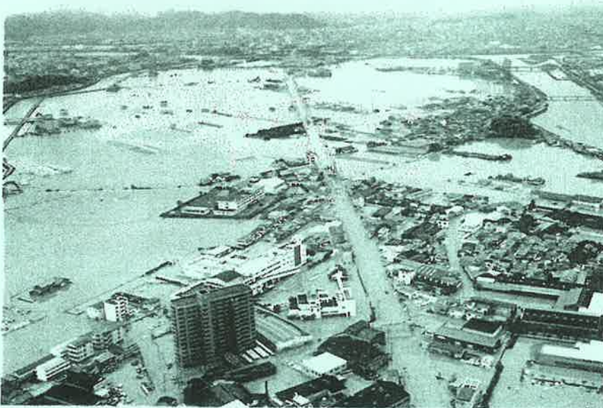
(高知市東部 1998 年 9 月)